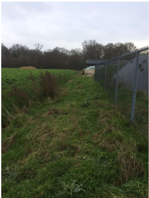
• Afbeelding 2: Foto's plangebied