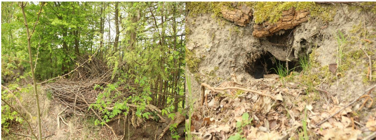
Foto links; de aanwezige takkenbossen liggen niet beschermd genoeg. Foto rechts; konijnenhol vastgesteld in het plangebied.

Er zijn in het plangebied geen beschermde grondgebonden zoogdieren waargenomen, maar het plangebied behoort vermoedelijk tot functioneel leefgebied van verschillende algemene- en weinig kritische grondgebonden zoogdiersoorten als huisspitsmuis, bosmuis, konijn, egel en steenmarter. Voorgenoemde soorten benutten het plangebied hoofdzakelijk als foerageergebied, maar mogelijk bezetten huisspitsmuizen, konijnen en bosmuizen er ook een vaste rust- en voortplantingsplaats. Deze soorten kunnen een rust- en voortplantingsplaats bezetten in holen en gaten in de grond. In de zandhopen in het plangebied zijn enkele konijnenholen vastgesteld. De aanwezige heesters zijn te open aan de onderzijde en er ontbreekt een strooisel laag waardoor deze niet geschikt zijn als rust- en voortplantingsplaats voor egel en steenmarter. De aanwezige takkenbossen liggen niet beschermd genoeg en vormen daardoor geen geschikte rust- en voortplantingsplaats voor egel en steenmarter. Gelet op de afstand van het plangebied tot houtsingels en houtopstanden en het ontbreken van geschikte rust- en voortplantingsplaatsen zoals houtstapels en holenbomen wordt het plangebied niet tot functioneel leefgebied van kleine marterachtigen beschouwd.