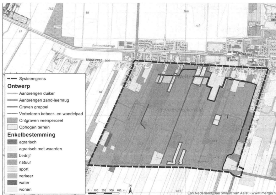
Figuur 1: Te wijzigen percelen in rood, beoogde zand-leemrug in zwart, woonpercelen in geel, agrarische percelen in lichtgroen en natuurgronden in donkergroen

Voor het behoud en ontwikkeling van de natuurlijke kenmerken van het Natura 2000-gebied Bargerveen worden diverse herstelmaatregelen in het deelgebied Schoonebeekerveld-West (SBVW) uitgevoerd.