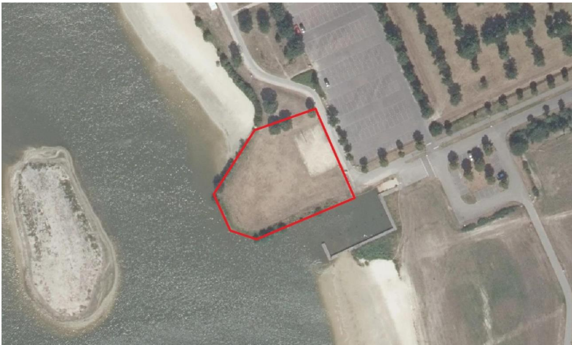
Afbeelding 1. Luchtfoto plangebied

Op de onderstaande afbeelding is een luchtfoto met een indicatieve begrenzing van het plangebied weergegeven. Het plangebied wordt ontsloten via de Grote Rietplas naar de Ericasestraat.