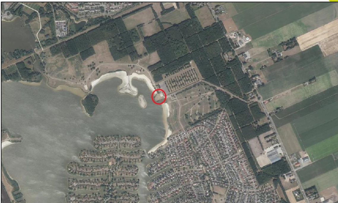
Afbeelding 1. Ligging plangebied (bron: pdok.nl/viewer, d.d. 29-01-2021)

Deze aanvraag is opgesteld voor het bestemmingsplan 'Emmen, Parc Sandur horecavoorziening Grote Rietplas'. Het voornemen bestaat om aan de Grote Rietplas een horecavoorziening van maximaal 500 m 2 te realiseren ten behoeve van dagrecreatie. Deze voorziening moet een kwaliteitsimpuls geven aan de beleving van de recreatieve waarde van de Rietplas.