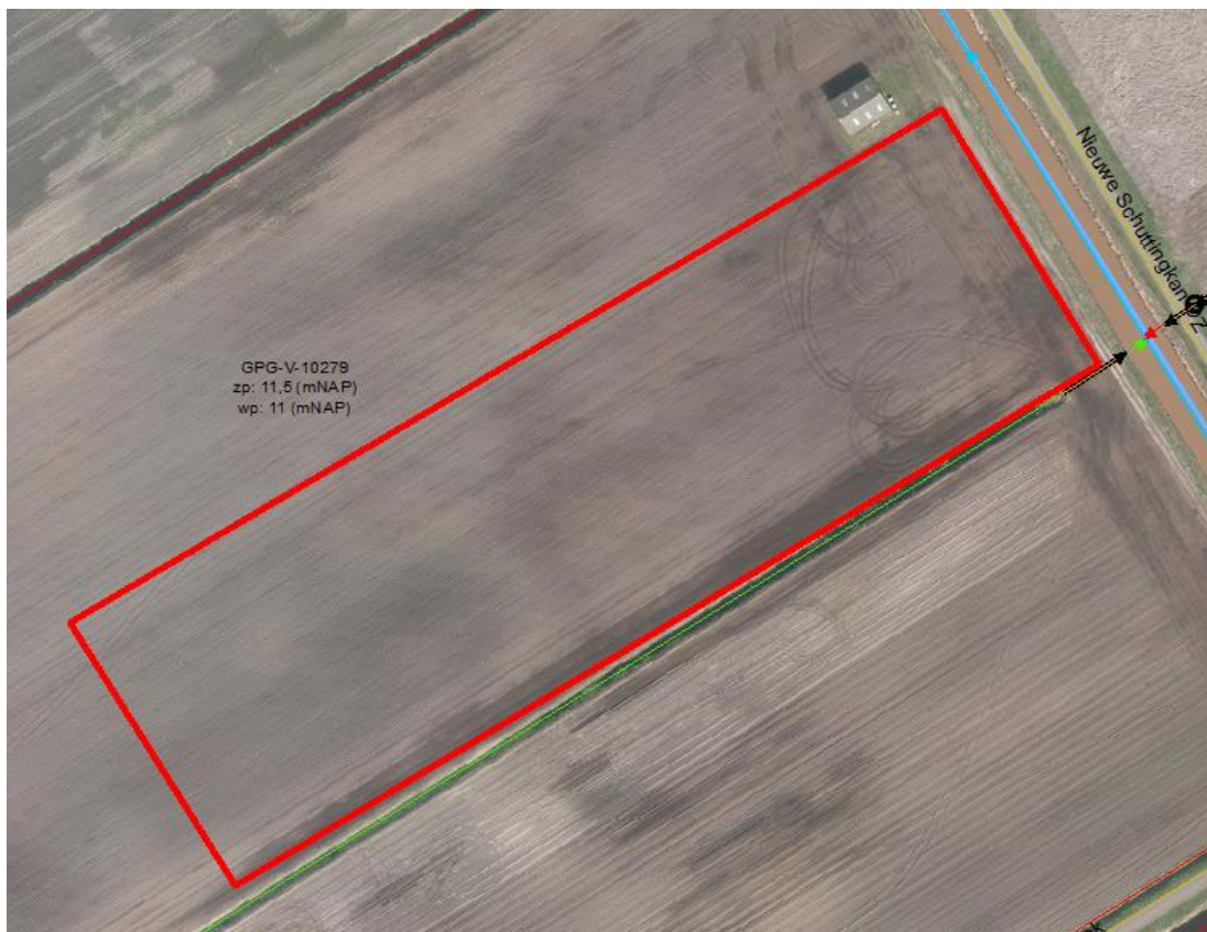
Figuur 1: Oppervlaktewatersysteem

Verhardingstoename van 20.000 m 2 resulteert in een bergingsopgave van 1.600 m 3 . Er wordt echter meer verhardingstoename mogelijk gemaakt omdat het beoogde bouwvlak 25.000 m 2 groot is. Bij bestemmingswijzigingen moet het waterschap waarborgen dat alle verhardingstoename die mogelijk wordt gemaakt wordt gecompenseerd. Tenzij in de regels bij het bestemmingsplan een expliciet maximum wordt gesteld aan het bebouwingspercentage, moet het hele bouwvlak worden meegerekend in de bergingsopgave (dit mag dan namelijk in zijn geheel worden verhard). De aanvullende 5.000 m 2 verhardingstoename die mogelijk wordt gemaakt via het bouwvlak resulteert in een aanvullende bergingsopgave van 400 m 3 . Dit houdt in dat de totale bergingsopgave voor het plan 2.000 m 3 is, voor een verhardingstoename van 25.000 m 2 .