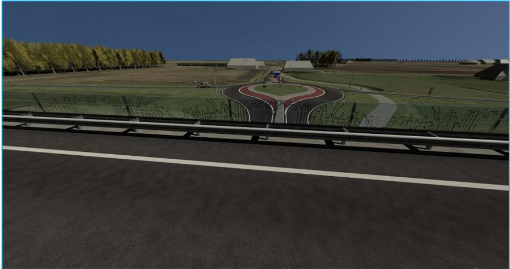
Vormgeving geluidscherm met daarin "Veenweg van Nieuw Dordrecht"