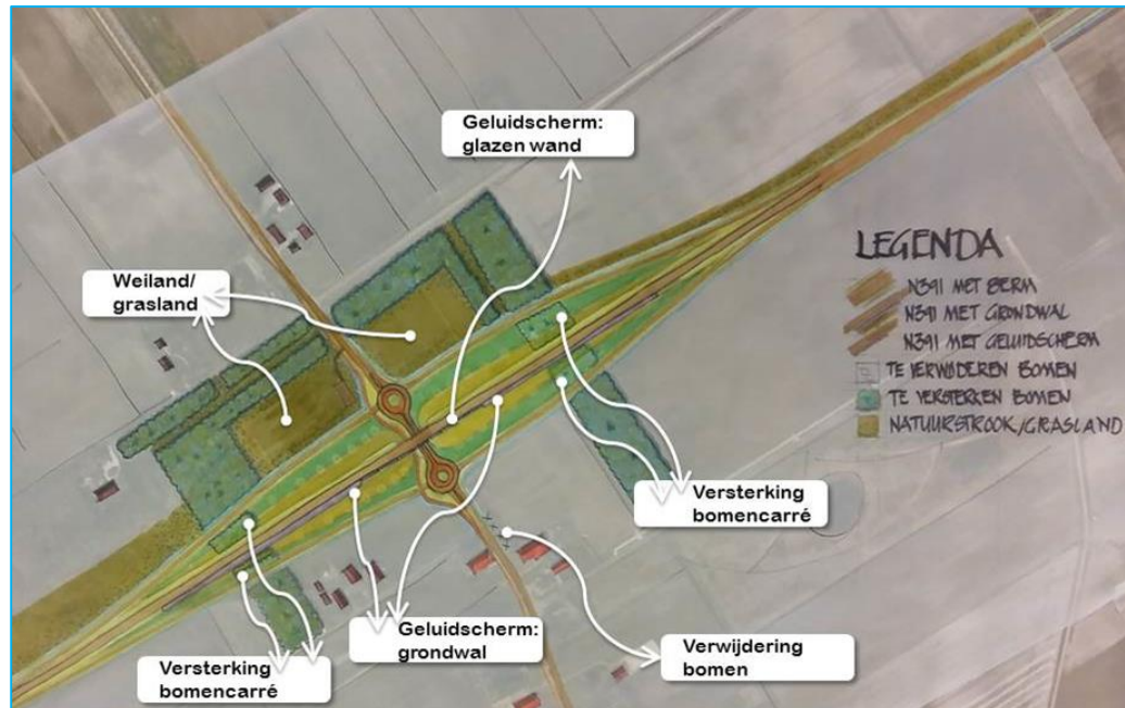
Landschapsplan N391 Roswinkel

De uitwerking van de landschappelijke inpassing in relatie tot de landschapsvisie heeft geleid tot onderstaande visualisatie.