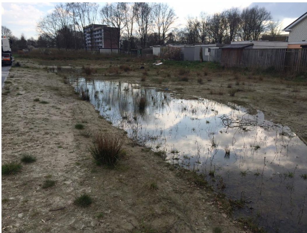
Figuur 4: Impressie van locatie Vleerackers.

Op locatie Vleerackers is geen bebouwing of opgaande begroeiing aanwezig. Daardoor kan de aanwezigheid van verblijfplaatsen van vleermuizen, (gebouw bewonende) vogels en Steenmarter op voorhand worden uitgesloten.