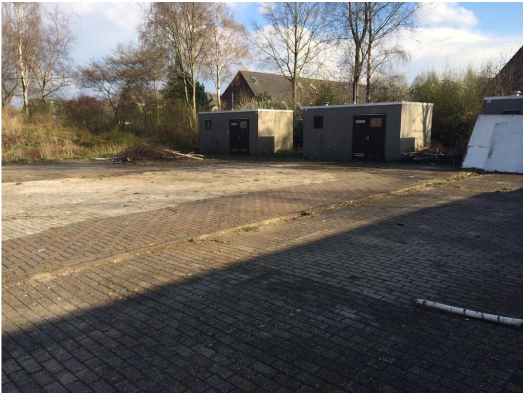
Figuur 5: Impressie van locatie Gierzwaluw.

De te bebouwen percelen op de Gierzwaluw zijn reeds voorzien van verharding. Afgezien van enkele planten tussen de stenen is er geen vegetatie aanwezig. De aanwezige schuurtjes (zie figuur 5) blijven in stand. Voor het overige zijn er geen gebouwen die worden gesloopt. Vanwege het nagenoeg ontbreken van vegetatie en te slopen gebouwen kunnen vogels, vleermuizen en Steenmarter op voorhand worden uitgesloten.