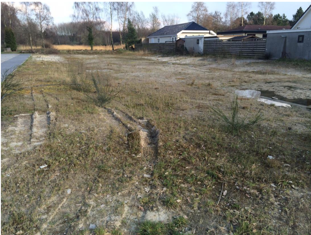
Figuur 6: Impressie van locatie Lijsterveld.

Er zijn geen gebouwen aanwezig op locatie Lijsterveld. Opgaande vegetatie ontbreekt eveneens waardoor vogels, vleermuizen en Steenmarter op voorhand kunnen worden uitgesloten.