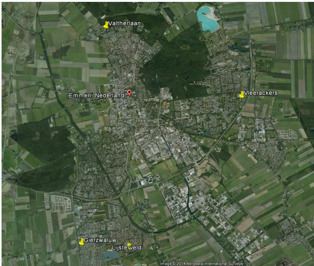
Figuur 1: De ligging van woonwagenterreinen in Emmen.

De bouwlocaties maken onderdeel uit van bestaande woonwagenterreinen. De locaties die bebouwd zullen worden zijn in alle gevallen reeds bouwrijp gemaakt of van verharding voorzien. In één geval gaat het om woonwagens die zullen worden verwijderd.