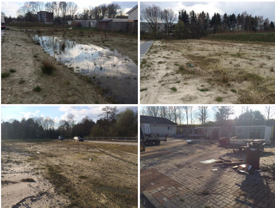
Figuur 2: Impressie van de plangebieden. Van links naar rechts en boven naar beneden: Vleerackers 2x, Gierzwaluw en Lijsterveld.

De bouwlocaties maken onderdeel uit van bestaande woonwagenterreinen. De locaties die bebouwd zullen worden zijn in alle gevallen reeds bouwrijp gemaakt of van verharding voorzien. In één geval gaat het om woonwagens die zullen worden verwijderd.