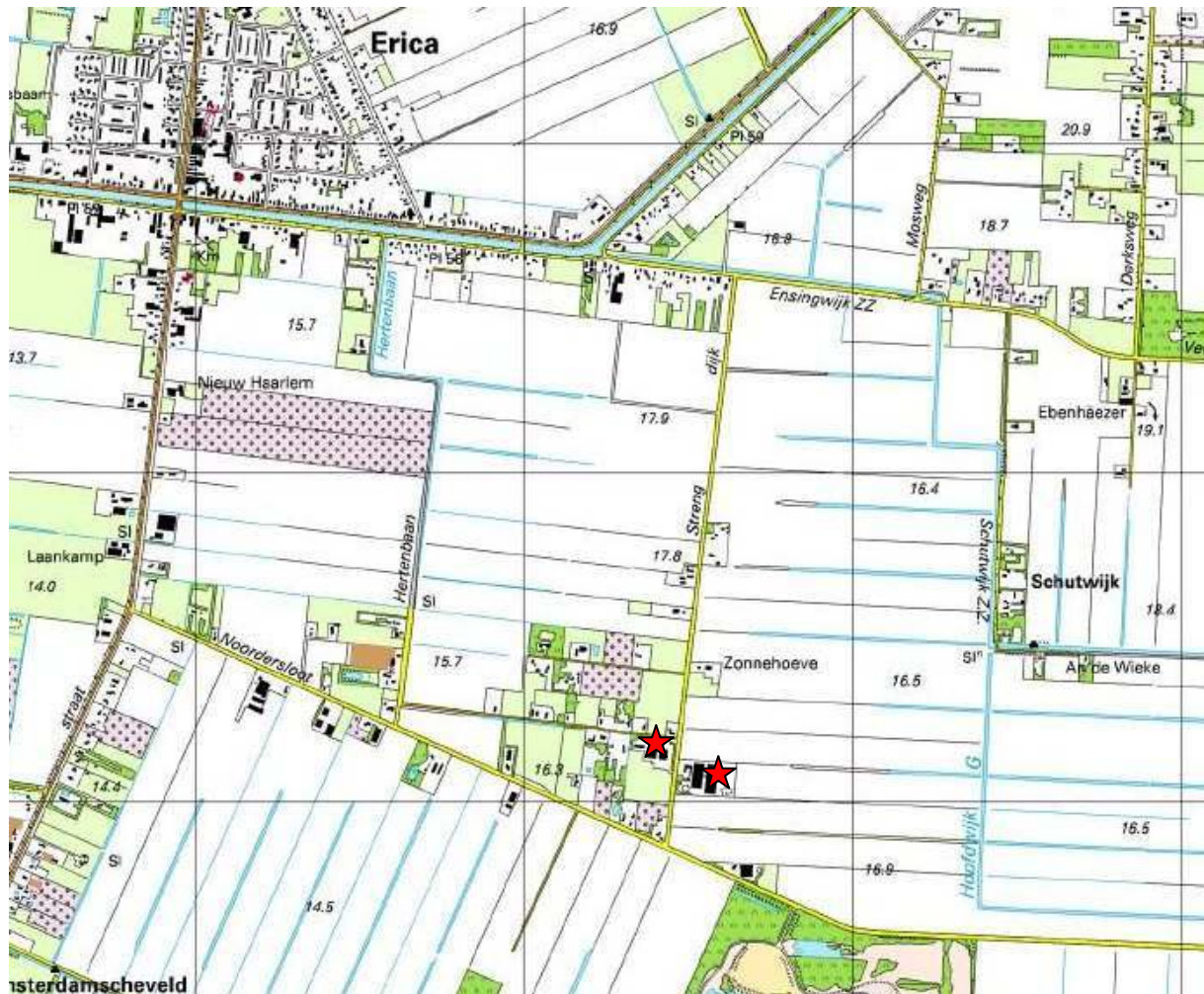
Figuur 2.2: Ligging van de bedrijfslocaties aan de Strengdijk 50 en 71 te Erica, bron: http:// kadata.kadaster.nl

De onderhavige bedrijven zijn gelegen aan de Strengdijk te Erica, ten zuiden van het dorp Erica in de gemeente Emmen.