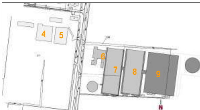
Figuur 3.1: Stalaanduiding

De voorgenomen activiteit, in dit rapport ook wel aangeduid als 'voorkeursalternatief' (VKA), betreft het concentreren van de bedrijfslocaties aan de Strengdijk 50 en 71, waarbij het bedrijf op nummer 71 wordt beëindigd en het bedrijf aan de overkant van de weg (nummer 50), wordt uitgebreid.