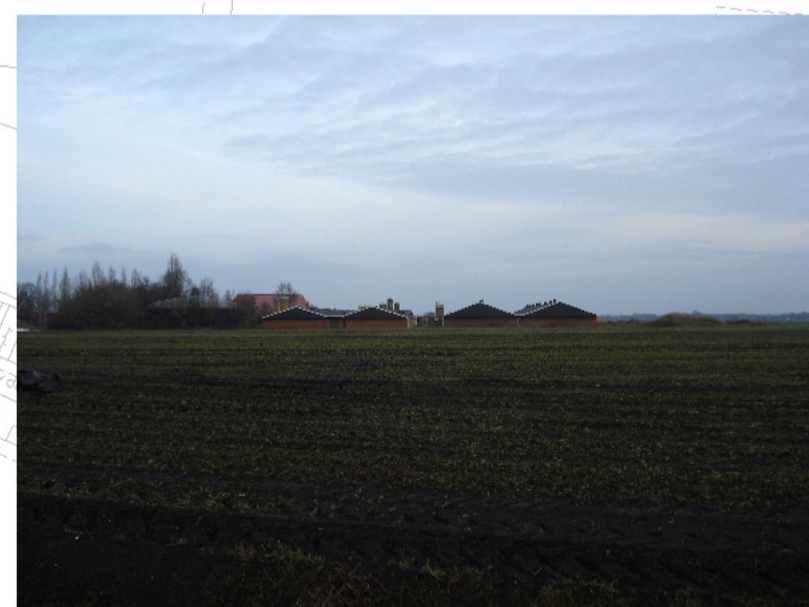
zicht vanaf Noordersloot