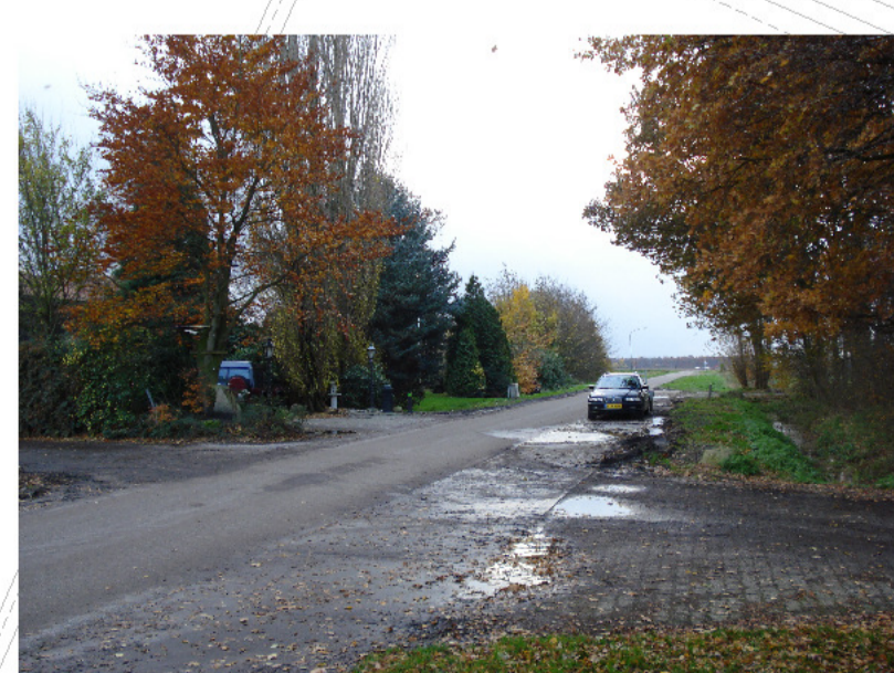
erf van strengdijk(noord)