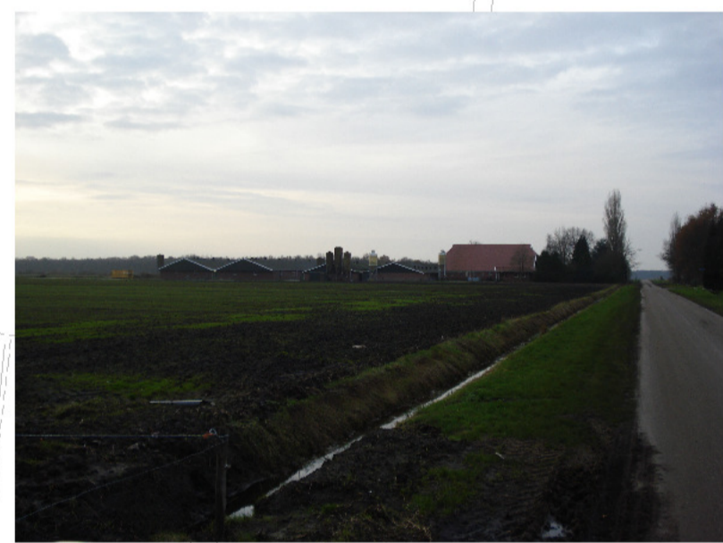
zicht vanaf Strengdijk