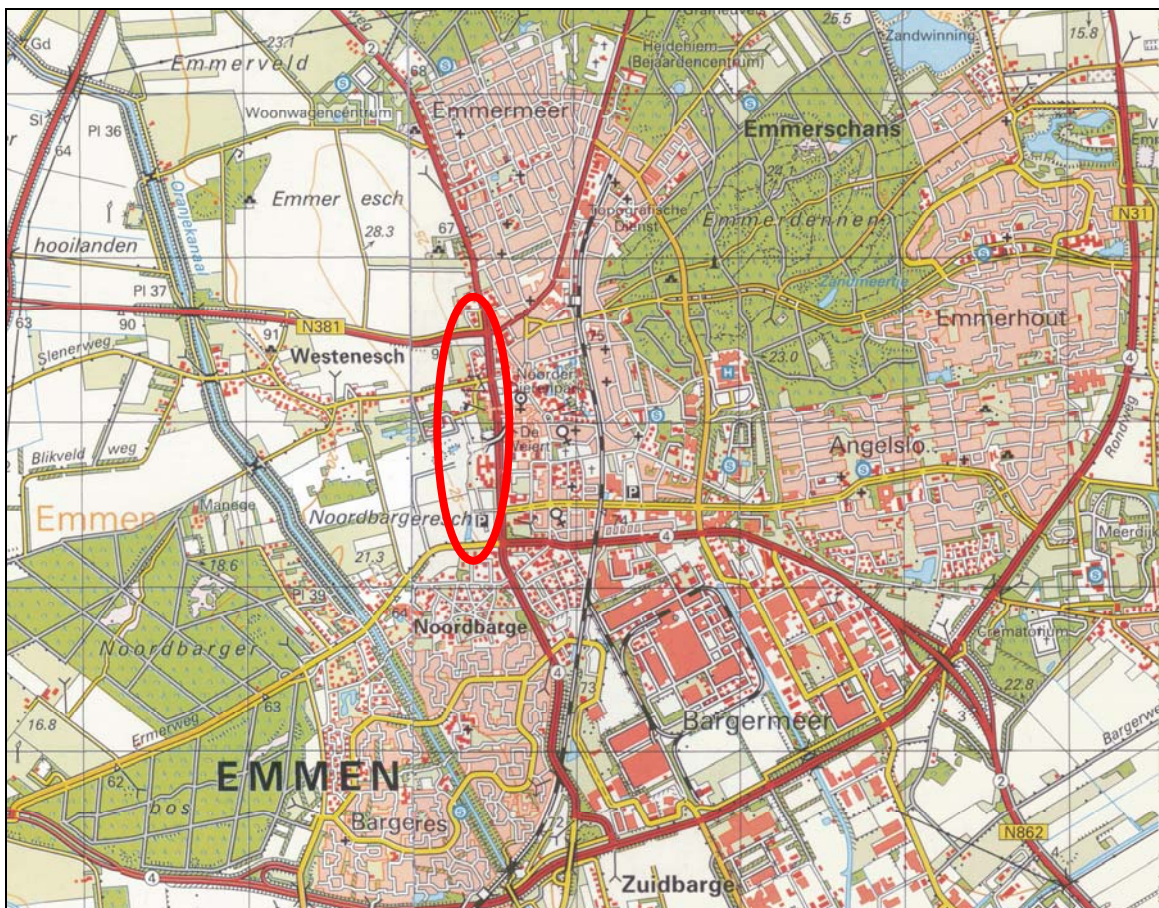
Figuur 1. Globale ligging van het reconstructiegebied te Emmen.

Er bestaat het voornemen om een gebied rond de Hondsrug, tussen de Schietbaanweg en de Ermerweg in Emmen te reconstrueren. Deze verandering kan negatief zijn voor beschermde planten- en diersoorten. Op basis van beschikbare bronnen is ingeschat dat beschermde vleermuizen en mogelijk broedvogels voor kunnen komen in en direct rond dit gebied. Op grond hiervan heeft RBOI te Rotterdam, die de ruimtelijke procedure begeleidt, aan Adviesbureau Mertens BV te Wageningen verzocht om de beschermde vleermuizen in beeld te brengen en een inschatting te maken van het voorkomen van vogels met vaste rust- en verblijfplaatsen. Voor RBOI is het dan mogelijk om met de beschermde soorten rekening te houden. In onderhavig rapport wordt verslag gedaan van een veldinventarisatie naar deze soortgroep.