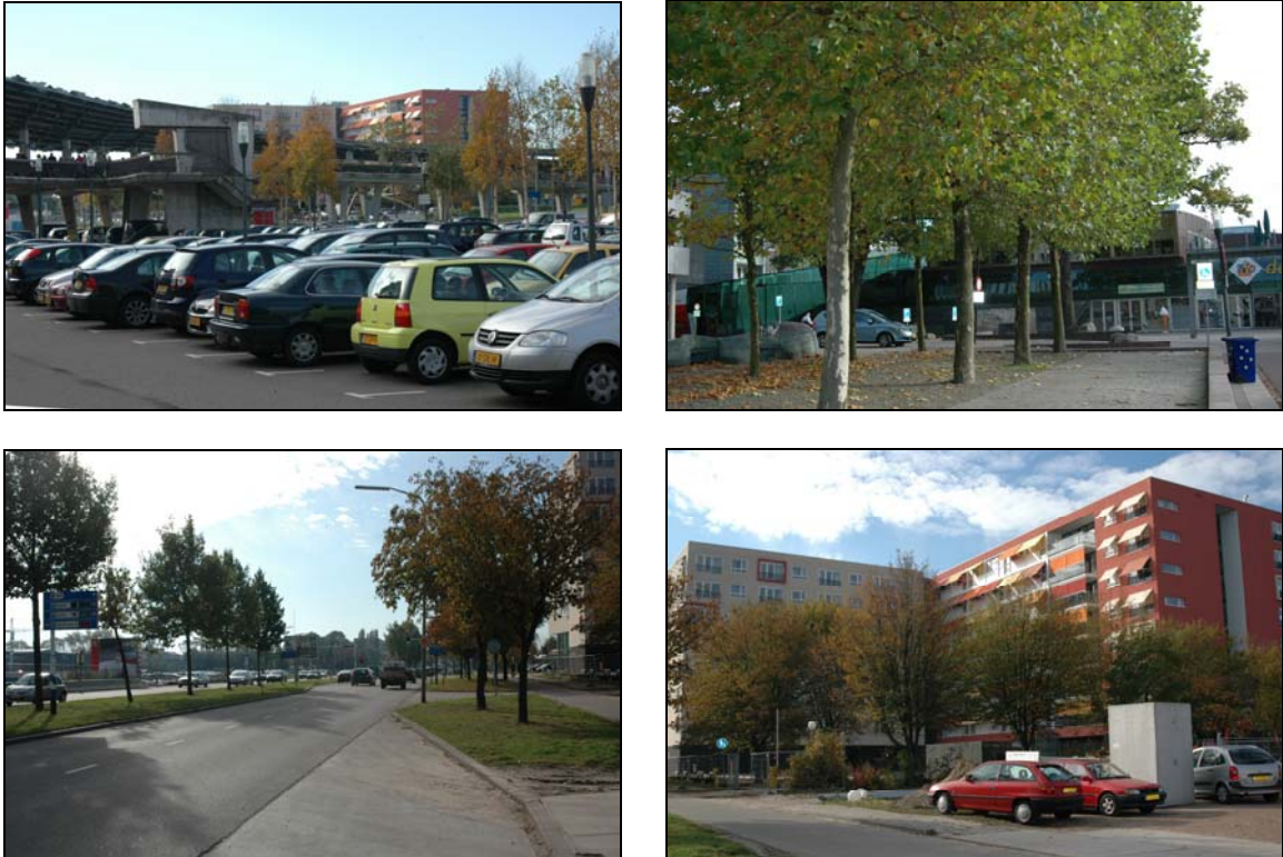
Figuur 2. Foto-impressie van het onderzoeksgebied te Emmen.