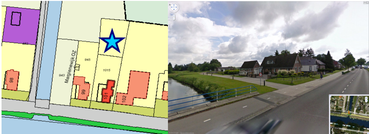
Afbeeldingen: Beoogde locatie